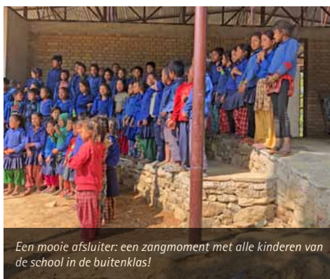
Een mooie afsluiter: een zangmoment met alle kinderen van de school in de buitenklas!