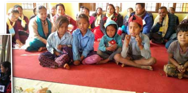
In Simras namen kinderen, 20 leerkrachten uit 15 verschillende scholen en zes CEPP staff deel aan de lerarenvorming.