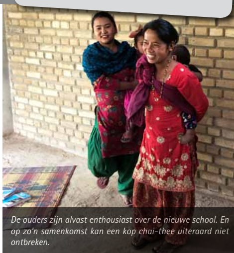
De ouders zijn alvast enthousiast over de nieuwe school. En op zo'n samenkomst kan een kop chai-thee uiteraard niet ontbreken.