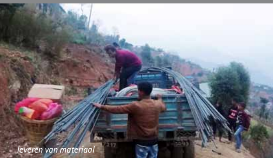
leveren van materiaal