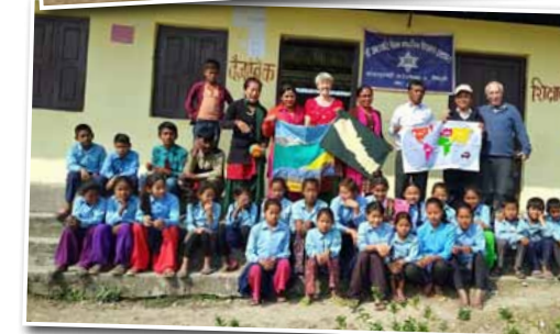
In Jutepani kwam een natuurlijke speeltuin tot stand.