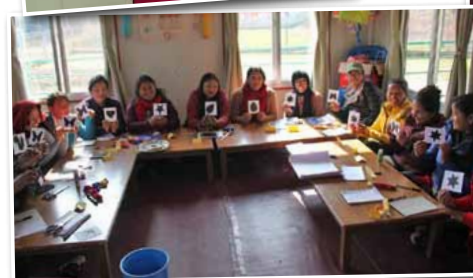
Een workshop voor 14 opvoeders van het Cerebral Palsy Centre. We maakten aangepaste materialen voor kinderen met een beperking, zoals deze high contrast prenten. Kinderen met CP hebben vaak ook visuele problemen.