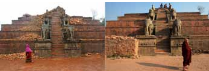
Bhaktapur Durbar Square, UNESCO werelderfgoed, op 30 april 2015 (links) en op 1 maart 2016 (rechts)