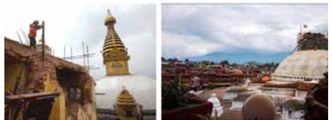
De heropbouw van de Swayambhunath stoepa (Monkey Temple, Apentempel) is nog maar juist begonnen. (links)