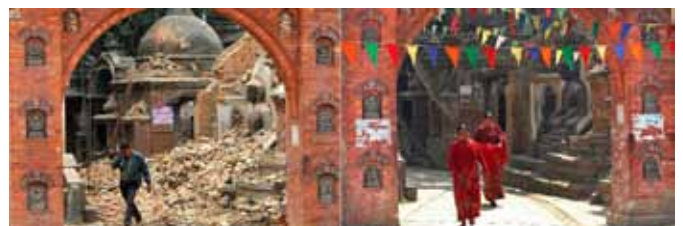
Bhaktapur, 26 april 2015 (links) en 29 februari 2016 (rechts)