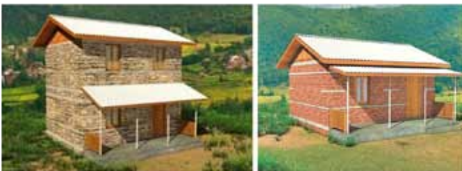
Aardbevingbestendige 'modelwoningen' van de Nepalese regering ontworpen voor de getroffen dorpen.