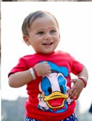
Een jaar geleden en vandaag: Een jongetje in Bhaktapur werd door het Nepalese leger vanonder het puin gered. Het leger heeft beloofd om het onderwijs van de jongen te steunen tot de bachelor's graad.