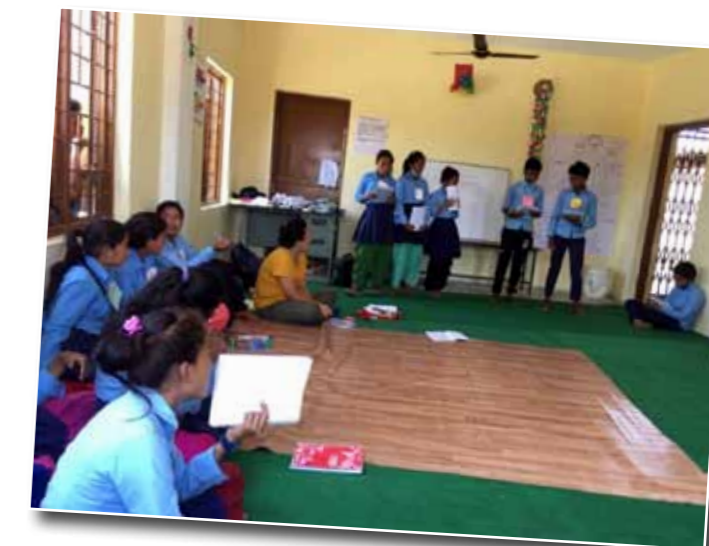
Foto 6: Kijken naar video's over de keuzes die leeftijdsgenoten maken

ook aangenomen wordt door de overheid en door Unicef. (foto 5 en 6)