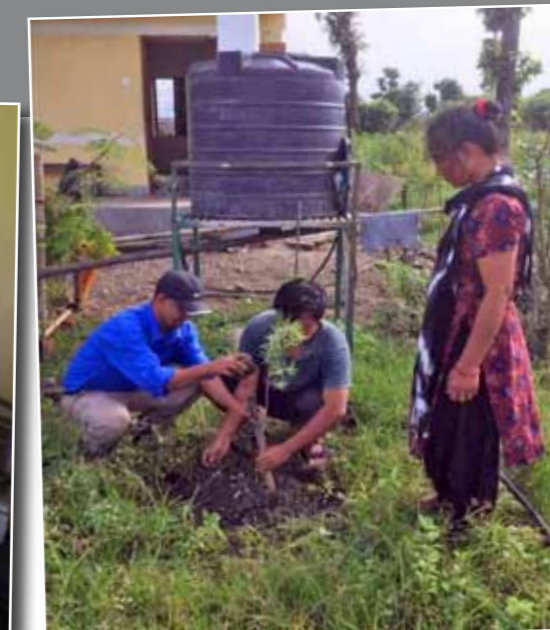
Foto 5: Het planten van schaduwboomen, zie ook de foto op de frontpagina