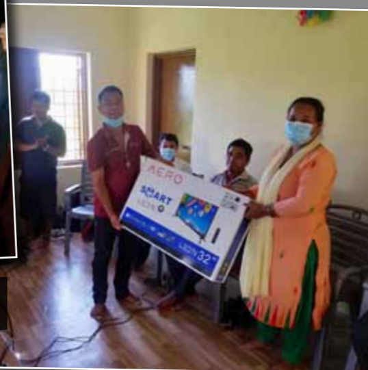
Foto 2: Na afloop van de training overhandigt de gemeente een smart TV aan een getrainde docent.