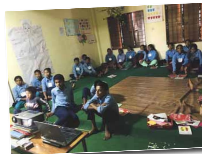
Foto 4: De kinderen zijn erg geïnteresseerd in de nieuwe manier van lesgeven en leren! Let ook op de ordelijkheid en het kindgerichte ontwerp van het klaslokaal: de kinderen zitten op de vloer, er zijn educatieve posters en door de leraar gemaakt materiaal.