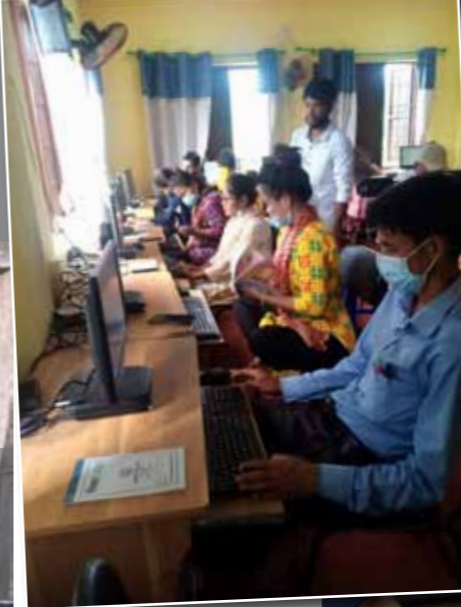
Foto 1: 90 leerkrachten nemen enthousiast deel aan de praktische lessen.

De Nepalese overheid heeft gekozen voor het pad van 'geïntegreerd lesgeven'. In plaats van verschillende vakken apart te geven, gaan docenten vakken integreren rondom een gekozen thema. Dit is nieuw voor ontwikkelingslanden als Nepal. CEPP draagt bij aan de inspanning door de vergroening van scholen te bevorderen en door 'life skills' te onderwijzen aan leerlingen van klas 6, 7 en 8. Ze willen het zelfbewustzijn van de adolescenten verhogen en hen leren omgaan met de veranderingen en emoties die bij dit levensstadium horen. Het doel is om vroege huwelijken te voorkomen en tieners te helpen doorstromen naar hogere klassen, een houding die